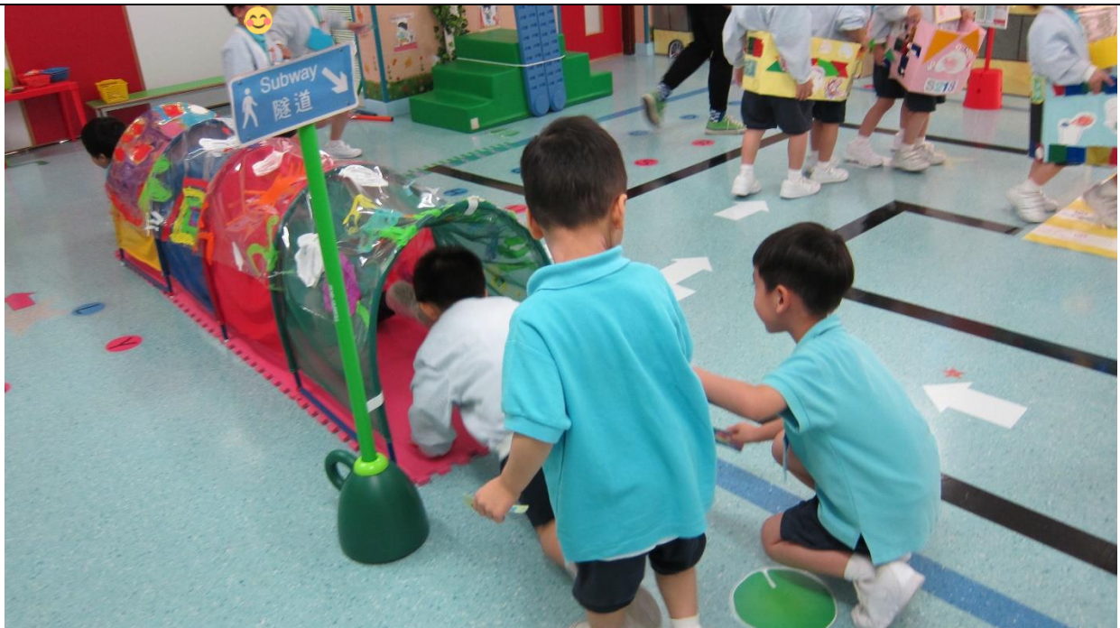
你看！這座行人隧道是我們一起繪畫 不同的色彩成為為隧道的特式！