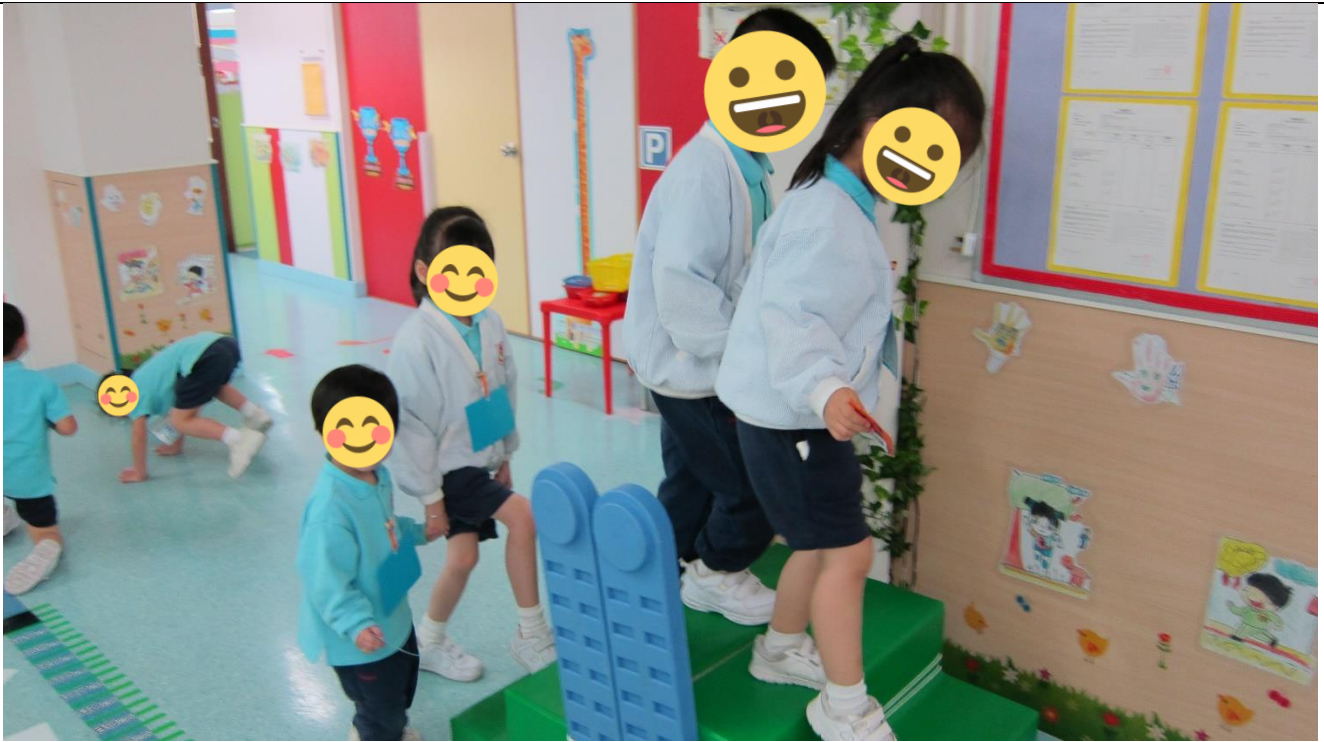
使用行天橋，一個跟一個，既安全又方便